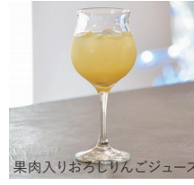
果肉入りおろしりんごジュース

100% Apple Juice 680 果肉入りおろしりんごジュース (サンふじ林檎 100% ストレート)