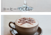
キャラメルラテ (HOT / ICED)