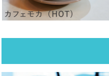
カフェモカ (HOT / ICED)