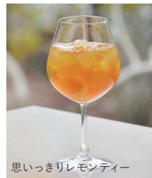
有機アイスティー