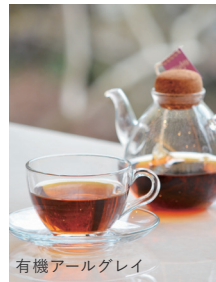
有機アールグレイ