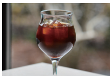
ソイラテ (HOT / ICED)