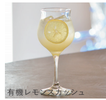
有機レモンスカッシュ

Organic Sparkling Lemonade 680 有機レモンスカッシュ